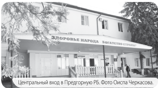
Центральный вход в Предгорную РБ.

- Прошло почти полгода моего руководства, при помощи и внимании, поддержке главы Предгорного муниципального округа Николая Бондаренко и спонсоров много сделано в вопросах укрепления материальной базы, вакцинации, обеспечения новым оборудованием. Получен новый передвижной флюорограф, спирограф, маммограф. В октябре устанавливаем аппарат УЗИ экспортного класса для обследования сердца и сосудов. Райбольнице выделено 7 машин для транспортировки врачей и пациентов. Установлена новая система обеспечения кислородом больных ковидом. Получено 4 газофикатора и проложены новые линии для кислородного обеспечения пациентов. Установлено 230 компьютеров для активизации работы врачей и для удобства больных, так как через компьютеры ведут онлайн-запись через колл-центр. Это будет способствовать углублению специализированной помощи, улучшить результаты в профилактике и лечении различных заболеваний. Всё делается для непрерывного обучения на аппаратуре и повышения квалификации врачей и медсестёр.