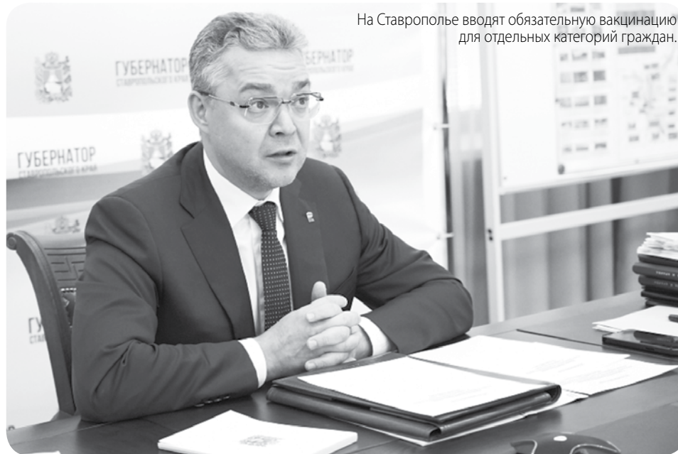
На Ставрополье вводят обязательную вакцинацию для отдельных категорий граждан.