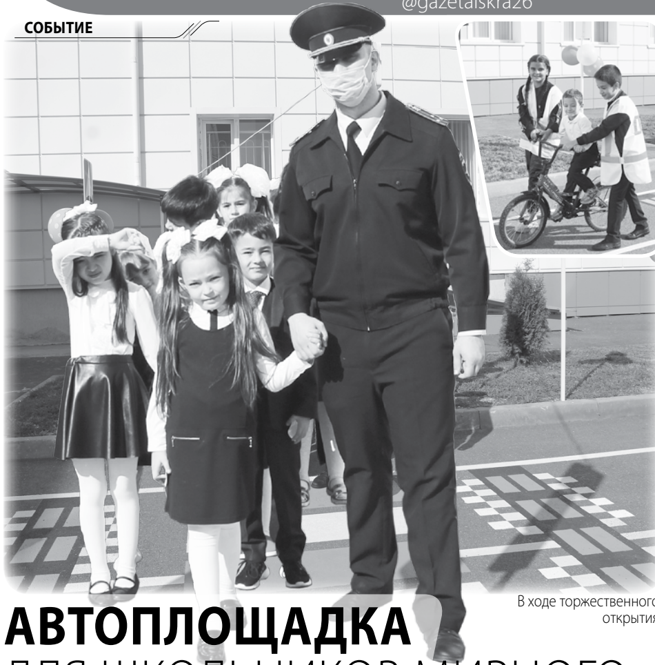
В ходе торжественного открытия